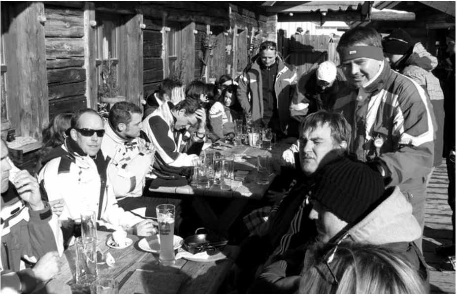
„Mittags“ auf der Hütt'n – Skifahrer und Wandergruppe gemeinsam