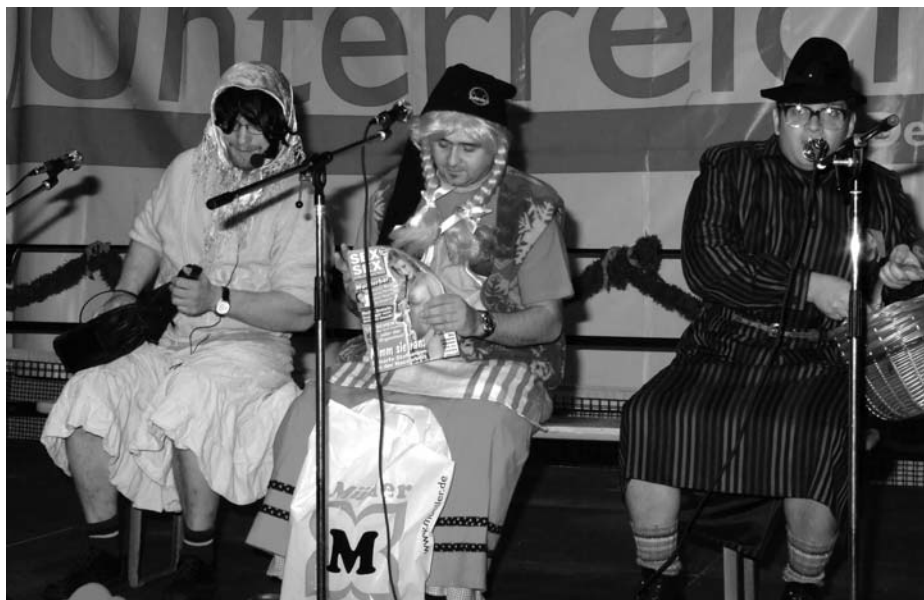
„Drei alte Schachteln in der Vorweihnachtszeit“