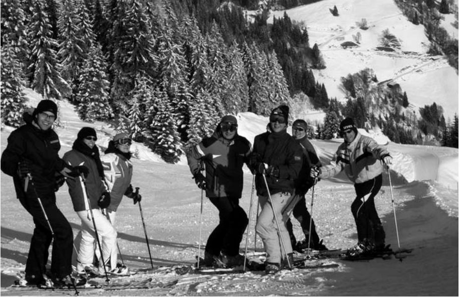
Auf der „Schwarzen 14“ – die Piste nur für uns ...