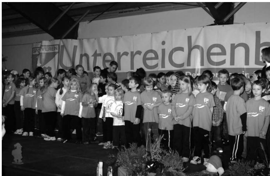
Unser Nachwuchs (Fußball und Kinderturnen)