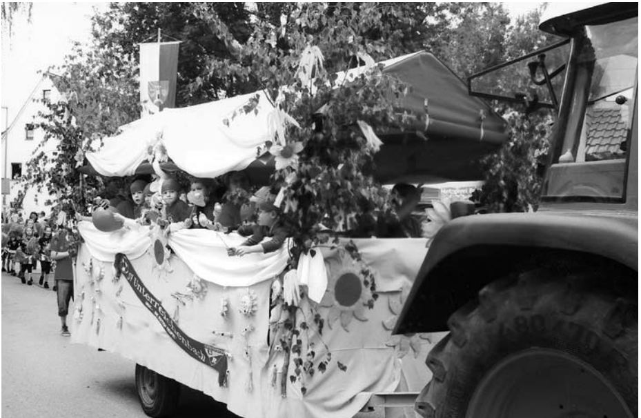
Kerwa-Umzug: Der toll geschmückte Wagen