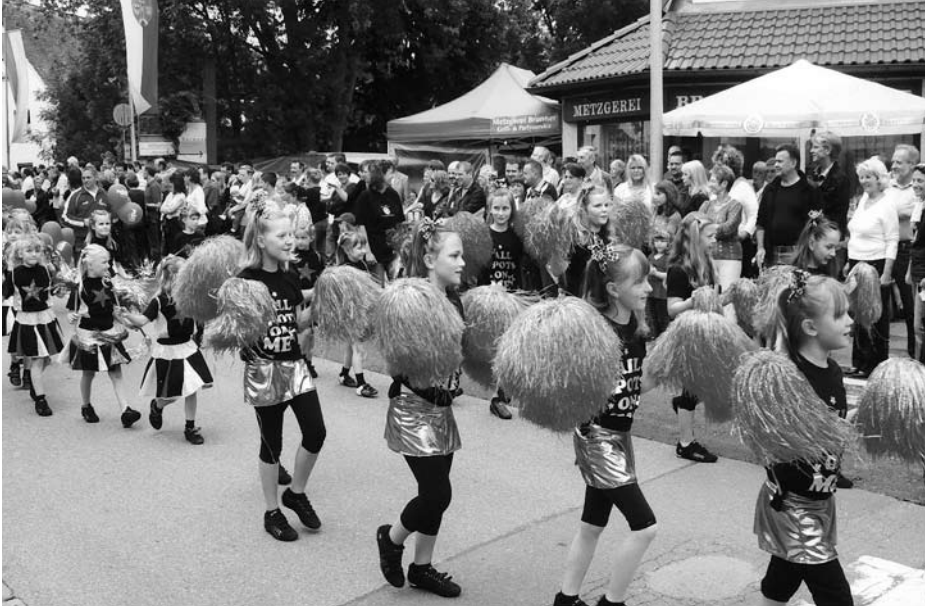
Kerwa-Umzug: Vor großem Publikum...