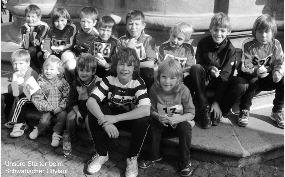
Unsere Starter beim Schwabacher Citylauf