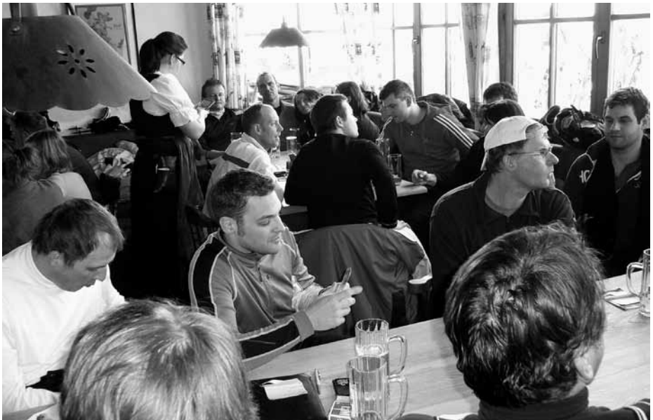
Auf der „Gipfel-Hütt'n“ – Skifahrer und Wandergruppe gemeinsam