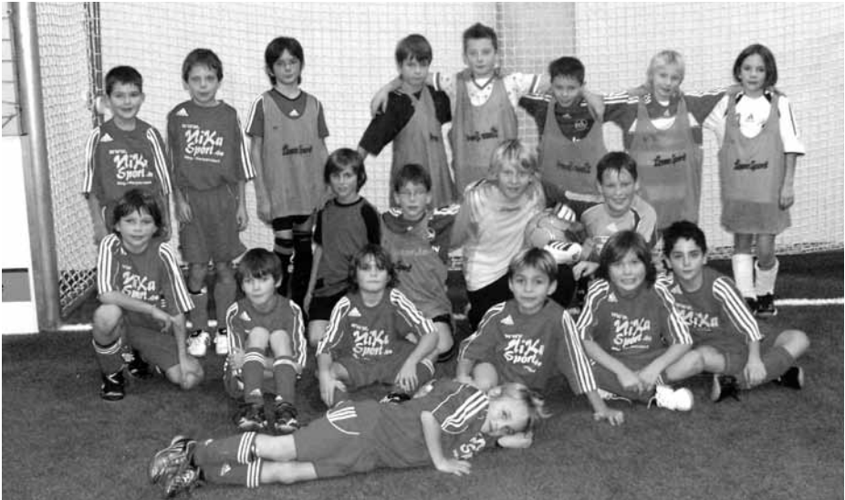
Unsere Jungs zusammen mit dem FC Ezelsdorf