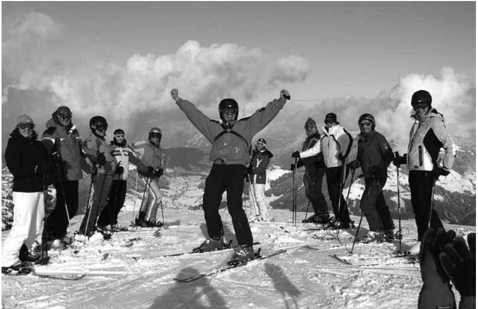
Endlich scheint die Sonne