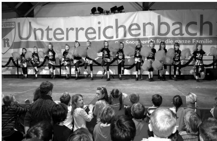
Cheerleaders in Action