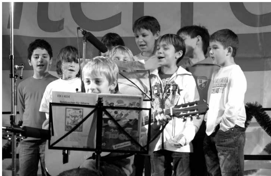
Unsere Fußballjugend mal anders (musikalisch)