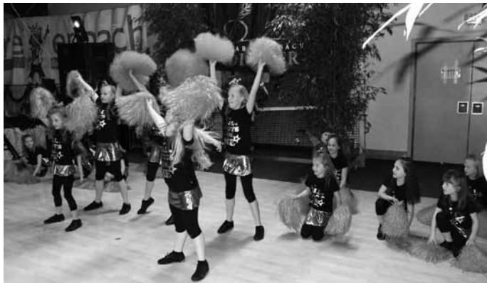
Cheerleaders in Action