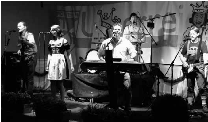
Die Münchner Partyband „Die Wiesnkönige“