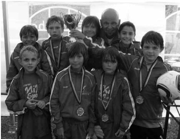
Klitschnass - aber der Wallenstein-Cup-Pokal gehört uns!

Nun geht es in eine neue Saison. Wir beginnen mit einem Blitzturnier am 12.09.10 in Wendelstein. Danach warten folgende Mannschaften in der BFV-Gruppe auf uns: TSV Katzwang, SV Penzendorf, SC 04 Schwabach, TSV Mühlhof-Reichelsdorf, TV 48 Schwabach und der FV Wendelstein.