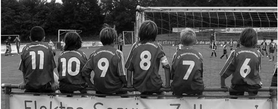
Auch nach dem Spiel herrscht bei uns Ordnung - wenn auch unbewusst...

Die darauf folgenden Turniere verliefen „ganz gut“. Abgesehen vom letzten Platz bei unserem eigenen Jugendturnier. Einen versöhnlichen Abschluss bildete der Sieg des Wallenstein-Cups in Altdorf.