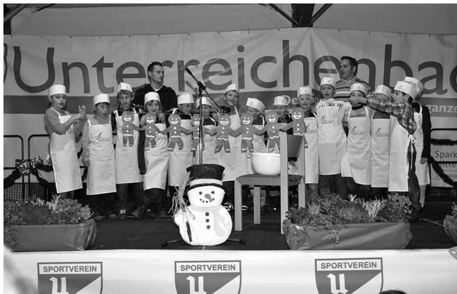
F1-Juniorer – „In der Weihnachtsbäckerei“