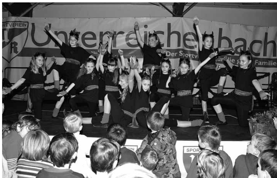
Tanzgruppe mit ihrer Abschlusschoreographie