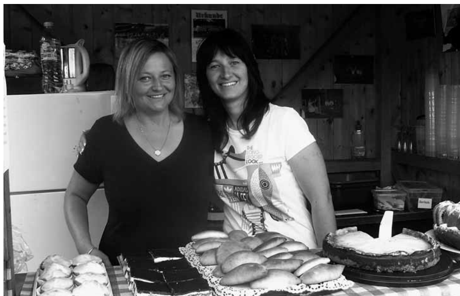
Auch fürs leibliche Wohl war natürlich gesorgt – nur möglich durch die Helfer(innen)