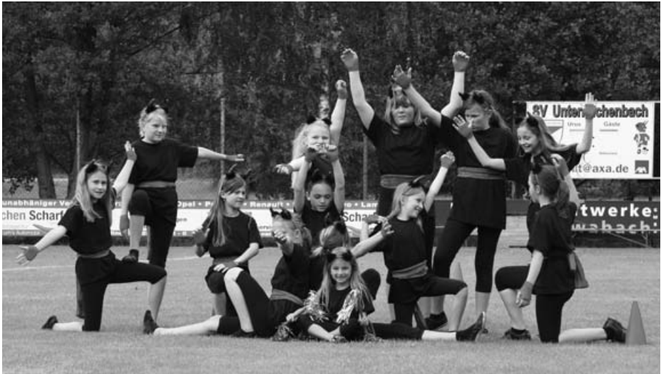
Die Tanzgruppe der Kinderturnabteilung - Abschlusschoreographie