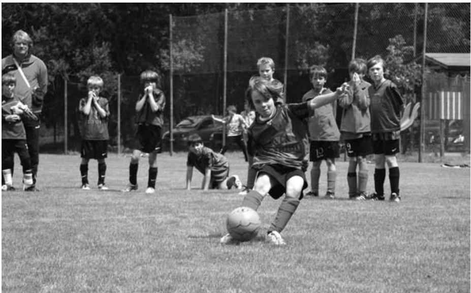
Bange Blicke und die Dynamik des Schützen beim 8-Meter-Schießen