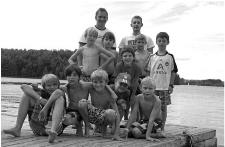
Saisonabschluss im Movin Ground Freizeitpark