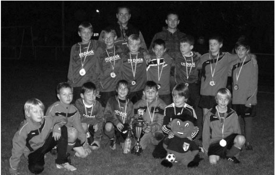
Herbstmeister 2011 E2- Jugend

Sieben Siege aus sieben Spielen bei 53:10 Toren. so liest sich die beeindruckende Bilanz unserer E2-Jugend nach der Herbstrunde. Somit holte sich die Mannschaft völlig verdient und souverän die Herbstmeisterschaft, was ein Riesen-Erfolg ist, da es uns noch nie zuvor gelungen ist, eine Runde auf dem 1. Platz zu beenden. So kannte der Jubel nach dem letzten Spiel beim TV 48 Schwabach, nachdem nun fest stand, dass wir ungeschlagen Herbstmeister geworden sind, auch keine Grenzen mehr. Wir feierten mit (Kinder-)Sekt, inklusive Sektdusche, schon wie die Großen. Als wir dann auch noch von den Eltern einen riesengroßen Pokal und jeder eine Medaille bekommen haben, ging es auf die Ehrenrunde mit abschließendem Mannschaftsfoto. Besonders hervorzuheben ist noch, egal in welcher Besetzung die Mannschaft gespielt hat, jeder gab immer sein Bestes. Somit wuchs man noch enger als Mannschaft zusammen und außerdem ließ man den Gegnern nie den Hauch einer Chance, das Spiel zu gewinnen.