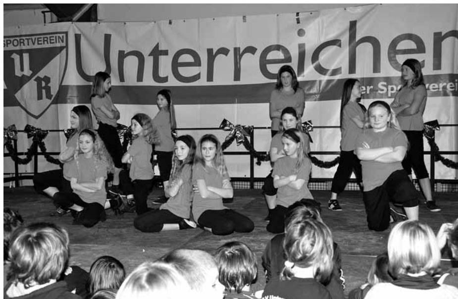
Schautanzgruppe der Kinderturnabteilung