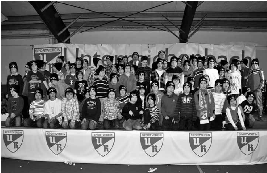
Fußballer-Kids mit ihren neuen Mützen