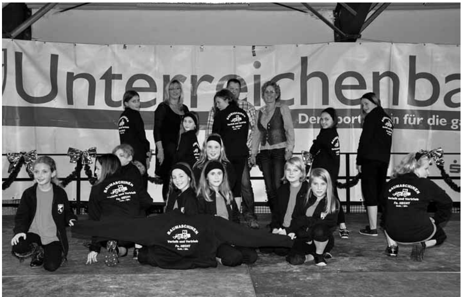
Die Turner-Mädels mit ihren neuen Jacken