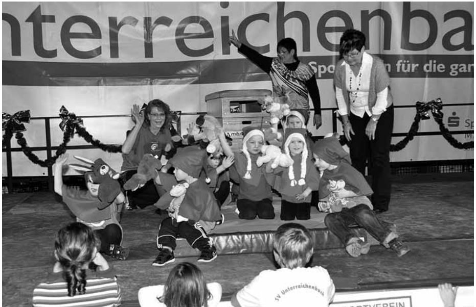
Die „Kleinsten“ der Kinderturnabteilung