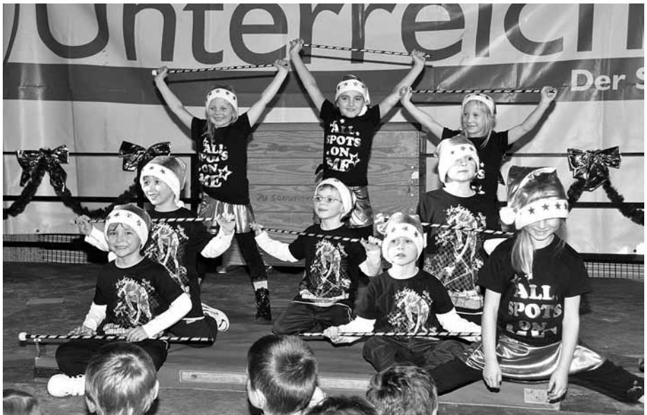
Die mittlere Gruppe der Kinderturnabteilung