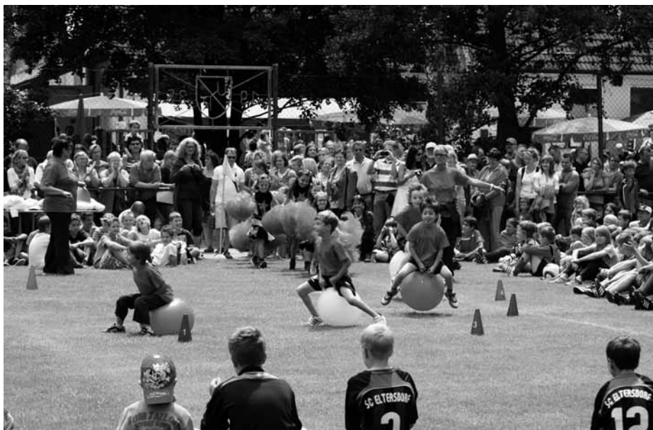
Vorführung der Kinderturnabteilung