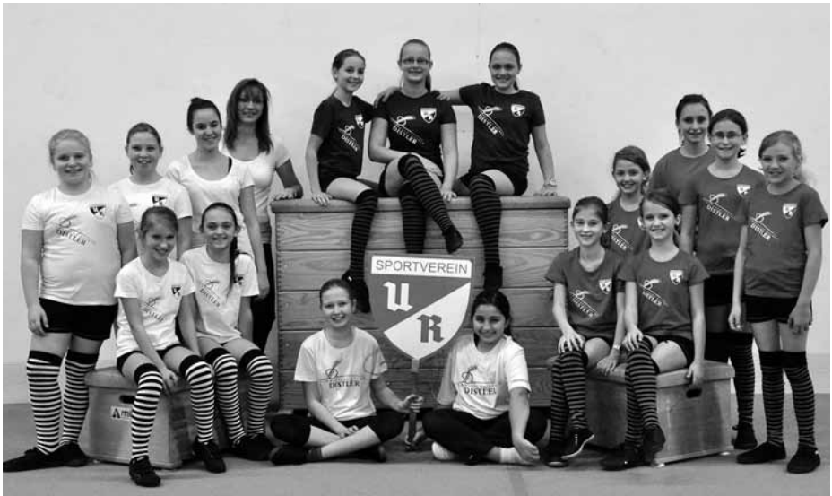
Das neue Outfit unserer Hip-Hop-Mädels, gesponsert von der Bäckerei Distler

Auch in der mittleren Gruppe sind einige neue Kinder zu uns gekommen. Natürlich werden die Turnübungen hier schon etwas schwieriger und auch die Vorführung für die Weihnachtsfeier zeigt eine Steigerung der Tanzschritte, der Übungen und der Ausdauer.