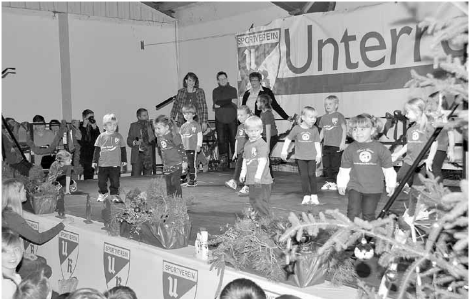
Die Kleinsten der Turner