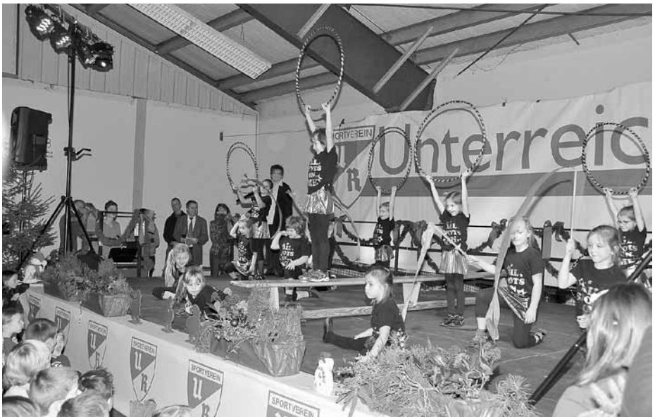
Die mittlere Turngruppe mit Reifen