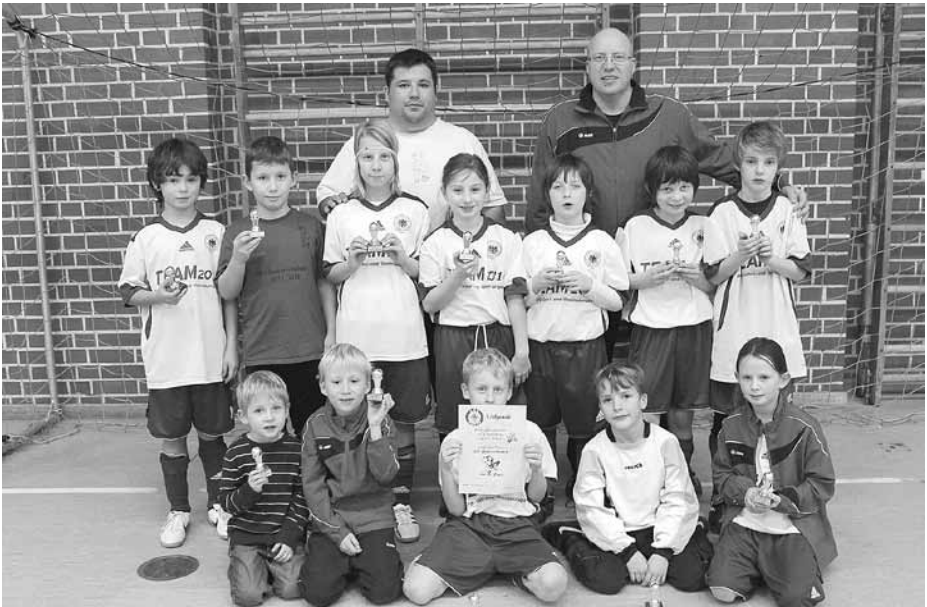
Das Bild zeigt die Spieler der E2 mit einigen Fans

Die E2 startete dann souverän in die Hallenkreismeisterschaft und belegte in der 1. Runde einen guten 2. Platz. Leider konnte diese gute Leistung in der 2. Runde nicht bestätigt werden, in der die Mannschaft äußerst unglücklich (nur im direkten Vergleich) ausgeschieden ist.