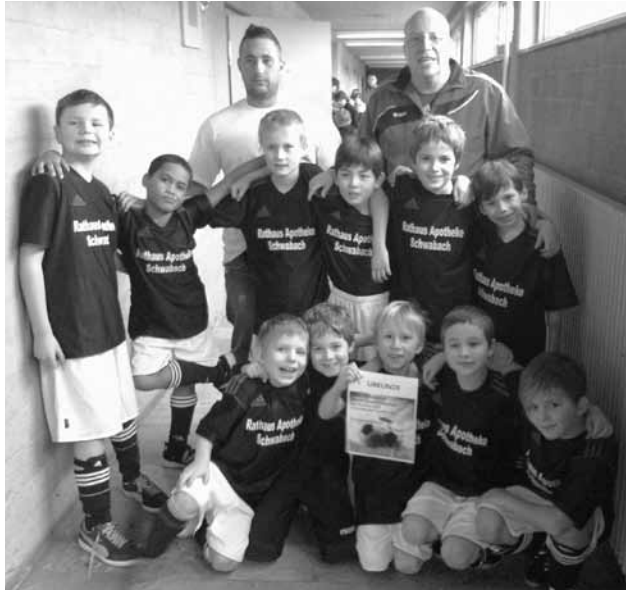
Alle unsere F1-Junioren nach dem eigenen Hallenturnier am 13.01.13

Besonderen Dank gilt auch der Rathausapotheke Schwabach, die uns für unsere F1 einen neuen kompletten Trikotsatz zur Verfügung gestellt hat. Wir bitten unsere Vereinsmitglieder bei Ihren Einkäufen unsere Förderer besonders zu berücksichtigen. Wir freuen uns über jede weitere Unterstützung, in welcher Art auch immer. Danke und weiter so!