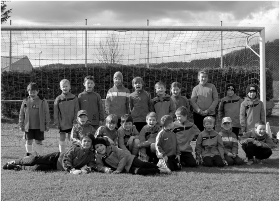
Trainingslager der E2- und F1-Jugend in Pommelsbrunn

Zum Auftakt der Freiluftsaison absolvierten dann die beiden Mannschaften Anfang April ein Trainingslager in Pommelsbrunn. Von Freitag bis Sonntag trainierten die Kinder für die kommenden Spiele. Während Trainer und Kinder in mehreren Trainingseinheiten Technik, Taktik und das Zusammenspiel miteinander übten, kümmerten sich die Frauen um das leibliche Wohl. Es gab Spaghetti Bolognese, Wiener und Gegrilltes. Bei einem Lagerfeuer und gemeinsamen Spielen kam neben dem nötigen Ernst beim Fußballtraining auch der Spaßfaktor nicht zu kurz.