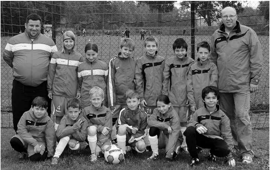
Mannschaftskader der E2 des SV Unterreichenbach Saison 2012/13:

Zum Saisonabschluss – jedes Jahr ein besonderes Ereignis für unsere Kids – veranstalteten wir dann ein Späturnier in der Soccer-Plaza, an dem neben unseren Fußballkindern auch die Geschwisterkinder mitmachen durften. Beim anschließenden gemeinsamen Essen mit den Eltern konnte dann den Kindern noch ein Fotoalbum mit den schönsten Fotos aus Training, Trainingslager und Saisonspielen der Saison 2012/13 überreicht werden.