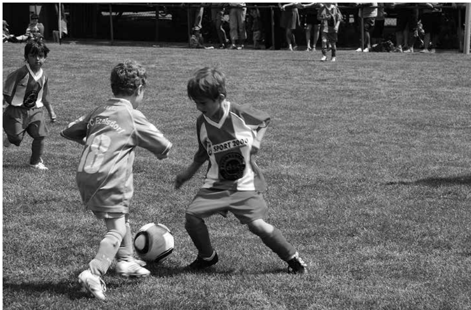
Die Kleinsten in Aktion