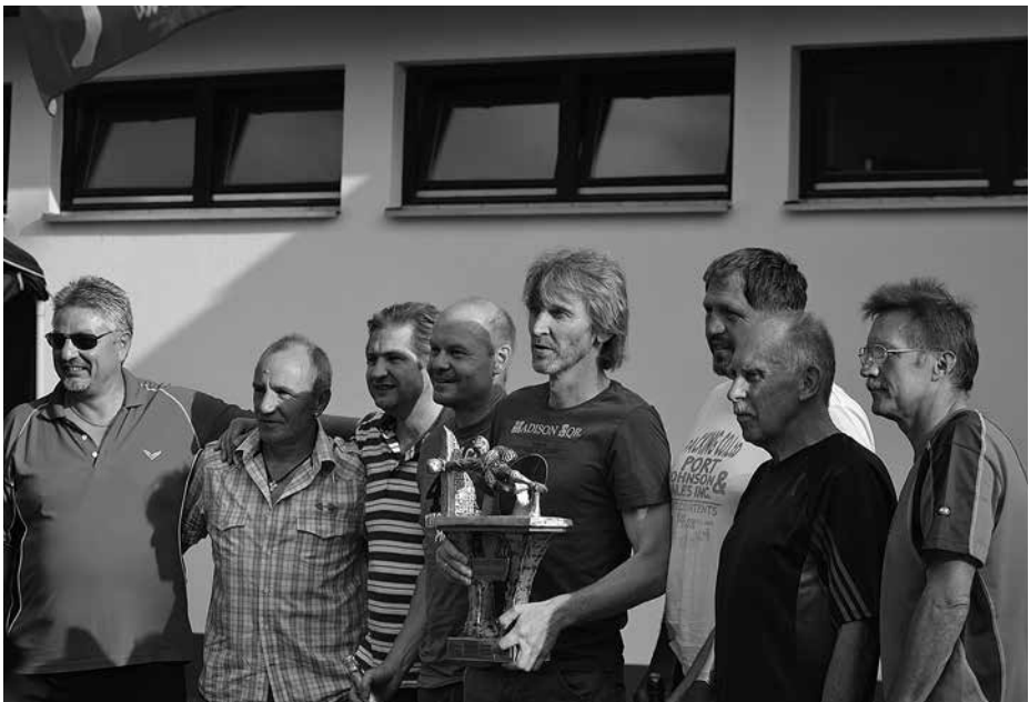
Siegerehrung nach dem Roland-Wabra-Gedächtnisturnier