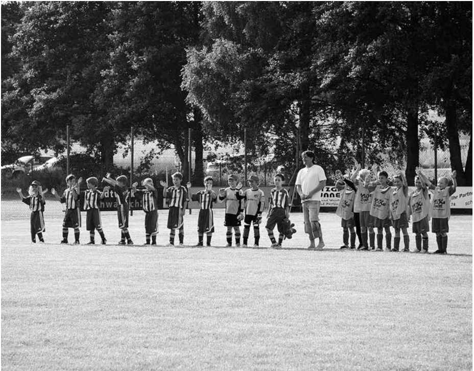
Vor dem großen Finale