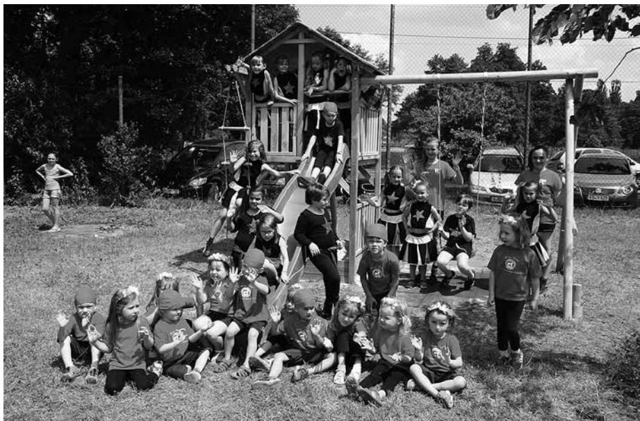
Kleine/Mittlere Kinderturngruppe vor dem Auftritt