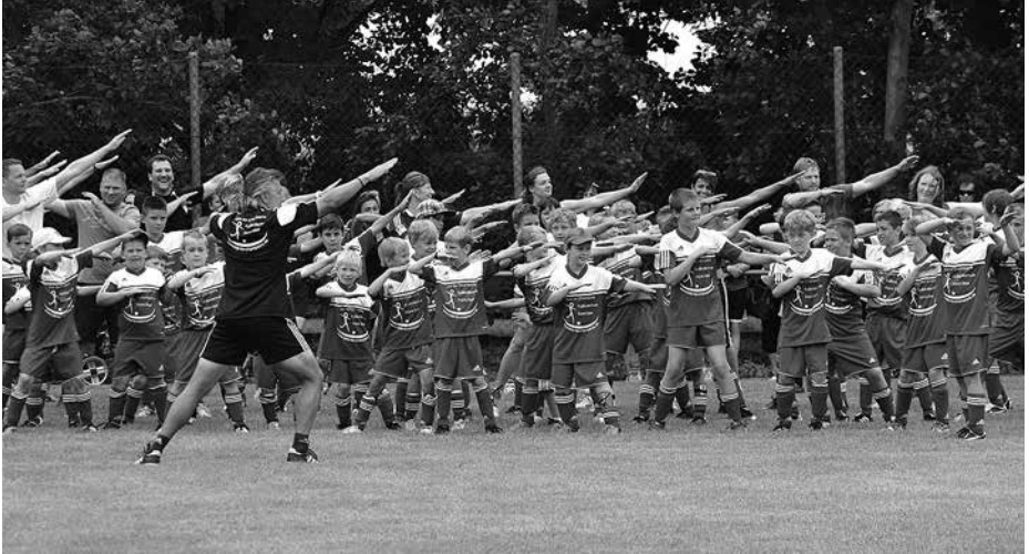
Gemeinsames Warmmachen mit den Eltern