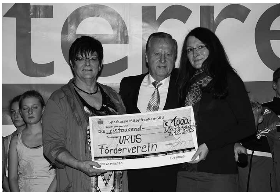
Scheckübergabe Förderverein „DIE URUS“