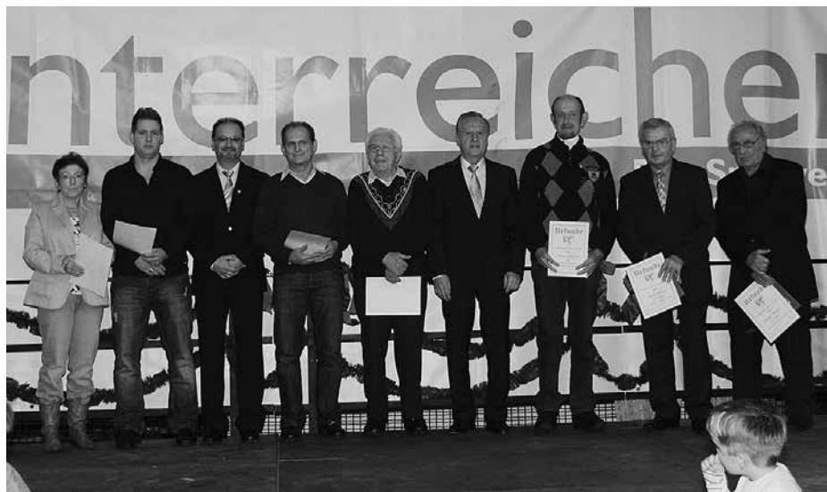
Alle anwesenden Geehrten