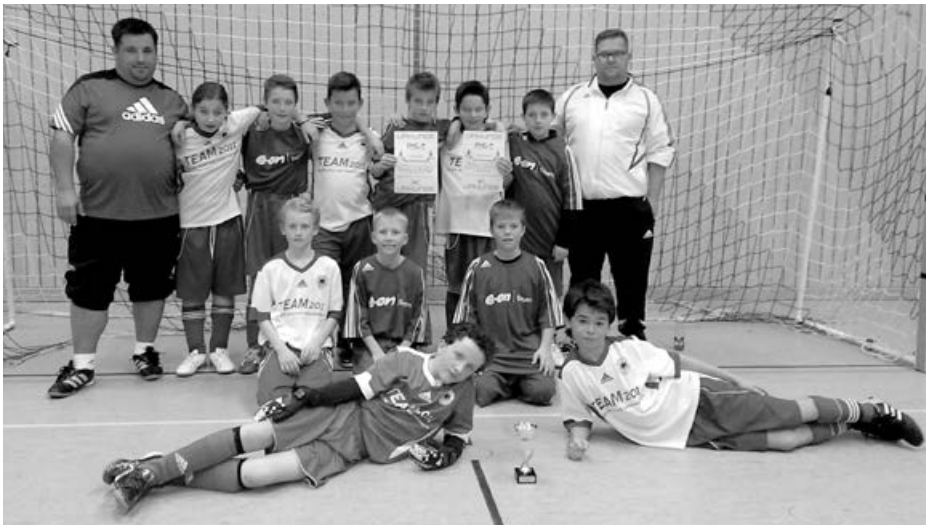
D3-Mannschaft beim Turnier in Ellingen am 15.11.2014

Nun freuen wir uns auf die kommende Hallensaison mit dem eigenen Turnier (15. Feb. 15) und dem zum dritten Mal ausgetragenen Teufels-Cup im Soccer Plaza (20. Dez. 14). Das erste Turnier in Ellingen habe wir mit 2 Mannschaften bestritten und den 2. und 3. Tabellenplatz erreicht.