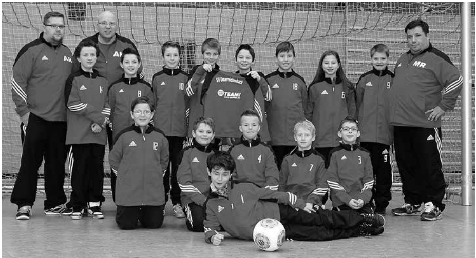
D3-Mannschaft beim eigenen Turnier am 23.11.2014 in ihren neuen Präsentationsanzügen

Auch bereits Tradition hat unser gemeinsamer Kegelabend Ende Januar. Darauf freuen sich die Kinder, aber auch die Eltern schon das ganze Jahr. Gemeinsam ein spannendes und spaßiges Ereignis, bei dem ungeahnte Talente sichtbar wurden.