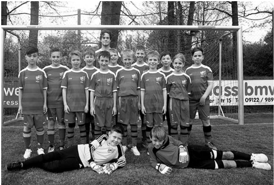
E2-Mannschaft im neuen Trainingsoutfit

Wie es aussieht, wird dann das Spiel in Wolkersdorf Mitte Juni die Entscheidung über die Liga-meisterschaft bringen. Die Mannschaft freut sich darauf und will den Meistertitel erkämpfen.