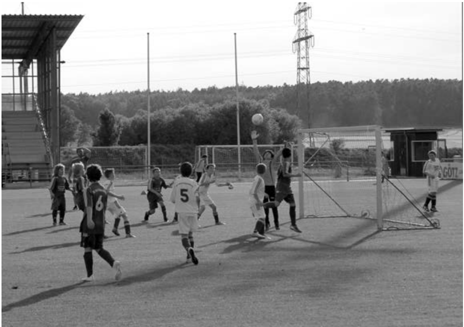
D3: Kampf um den Ball

Trotzdem sind wir schwer in die Rückrunde der Saison gestartet. Zu Beginn gab es Niederlagen gegen die Mannschaften des TV 48 Schwabach und des TSV Wolkersdorf, bei denen die Mannschaft ihr Potential noch nicht richtig ausschöpfen konnte. Besser machten es dann unsere Jungs in den zwei folgenden Spielen gegen die JFG Heidenberg und die JFG Schwarzachtal. Beide konnten jeweils deutlich gewonnen werden.