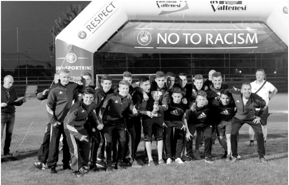
Siegerehrung (U17, 3. Platz)