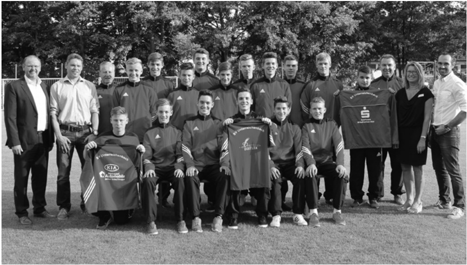
U17 (U19) neu eingekleidet