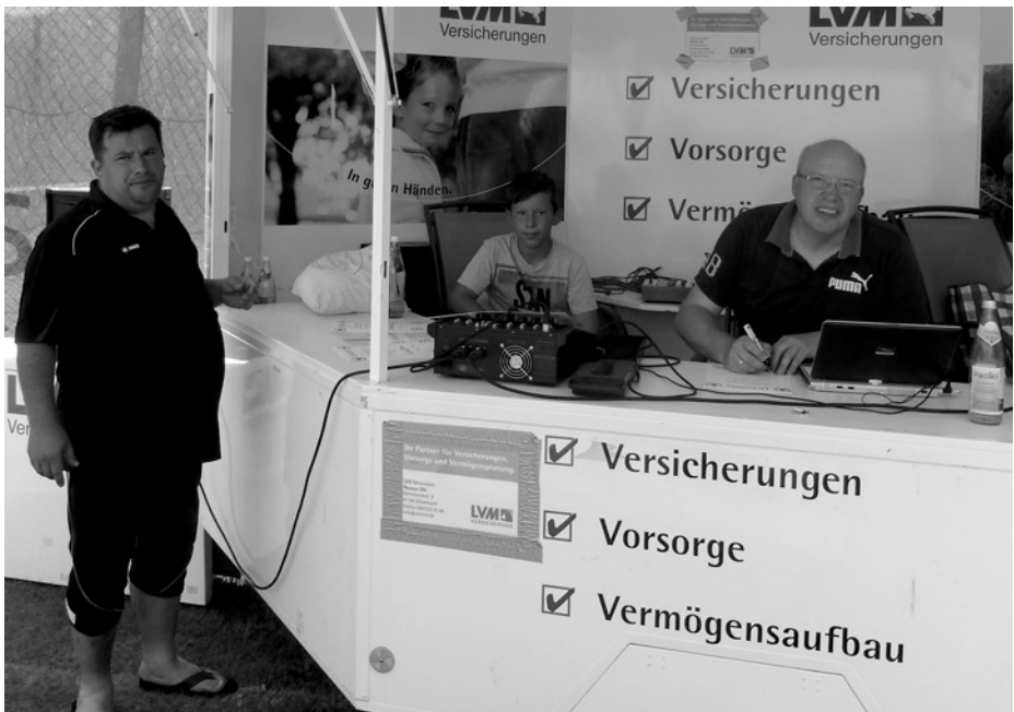
Turnierleitung am Sonntag (halbtags ...)