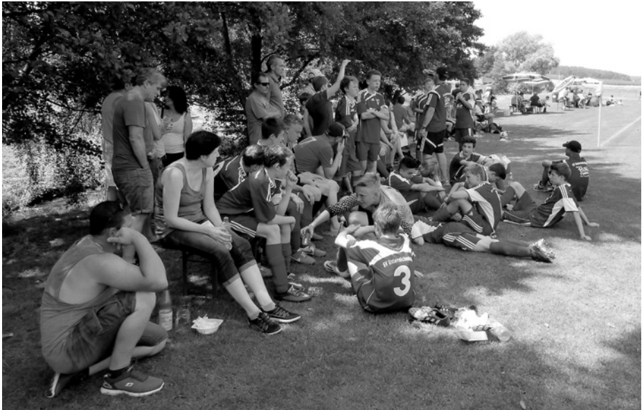
Ausruhen / Schatten...