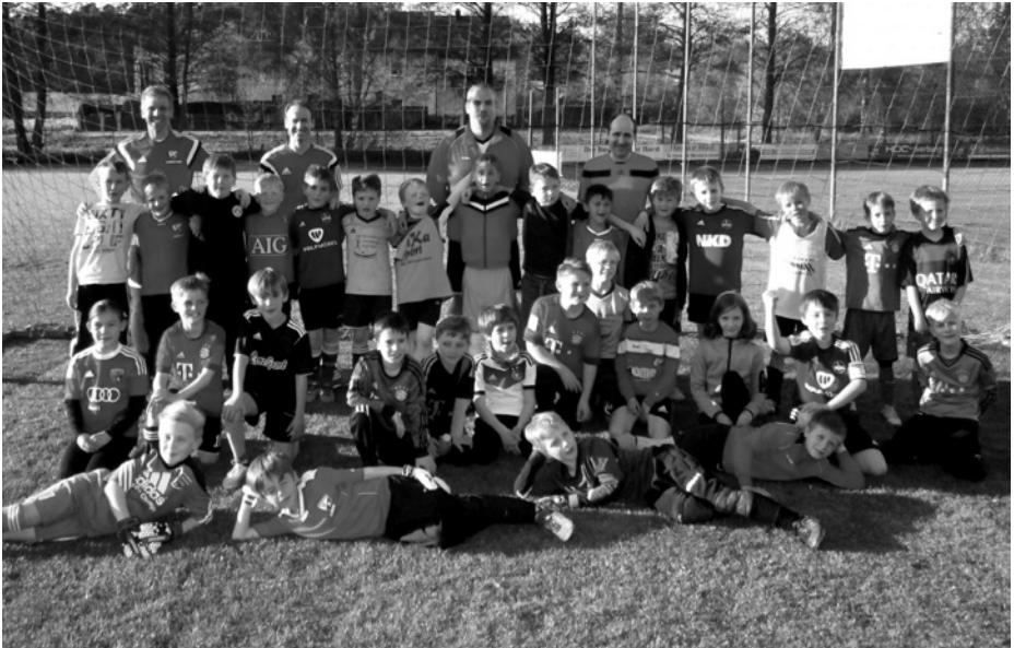
Die F-Teams mit ihren Trainern