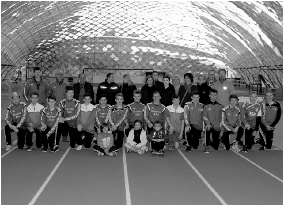
Unsere U17 mit Trainern und weiteren Reisebegleitern in Prag

Auch dieses Jahr nahmen wir wieder an einem internationalen Fußballturnier teil. Dieses Mal in Prag .