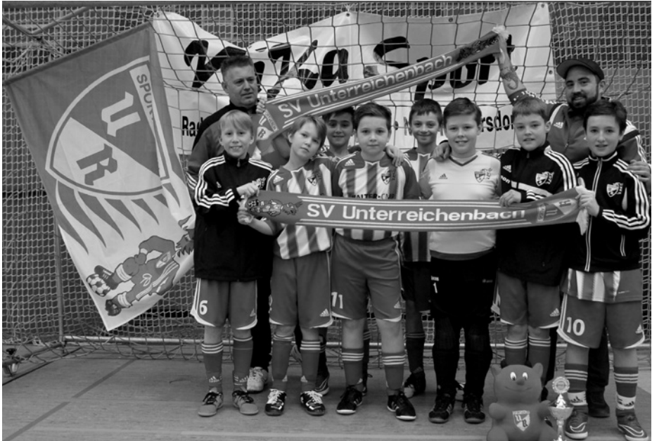
E1-Mannschaft nach dem Sieg der Stadtmeisterschaft

Zum Abschluss der Hallenmeisterschaft konnte unsere E1-Mannschaft nach dem äußerst unglücklichen Ausscheiden bei der Hallenkreismeisterschaft im Elfmeterschießen gegen den späteren Turniersieger aus Weißenburg mit einer überzeugenden Leistung die Stadtmeisterschaft in Schwabach gewinnen. Ein toller Erfolg für unsere Jungs.