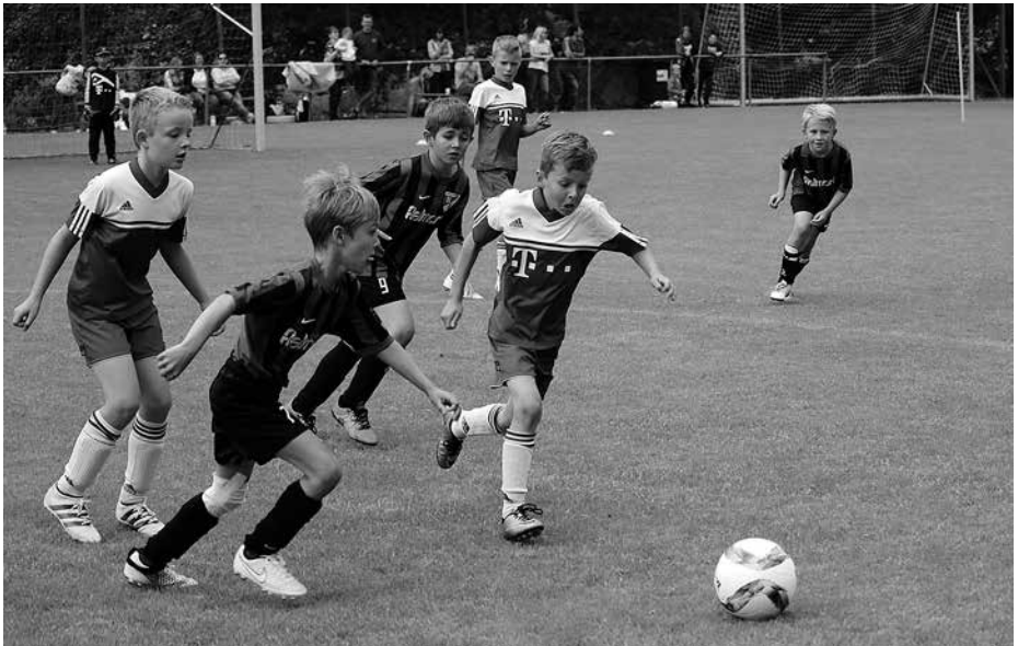
Action / Volle Konzentration