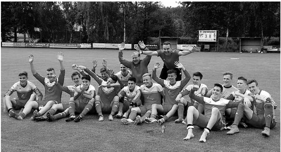
Die U19, nachdem die Meisterschaft gg. Allersberg erreicht war

Eine Woche später war mit Mörsdorf noch ein direkter Konkurrent in Unterreichenbach zu Gast, auch bei diesem Spiel fanden wieder 100 Zuschauer den Weg an die Volkachstraße. Sie mussten ihr Kommen nicht bereuen. Was die Mannschaft an diesem Mittwoch den Zuschauern bot war vom Allerfeinsten. Der Gegner hatte nicht den Hauch einer Chance und wurde mit 6:0 förmlich an die Wand gespielt.