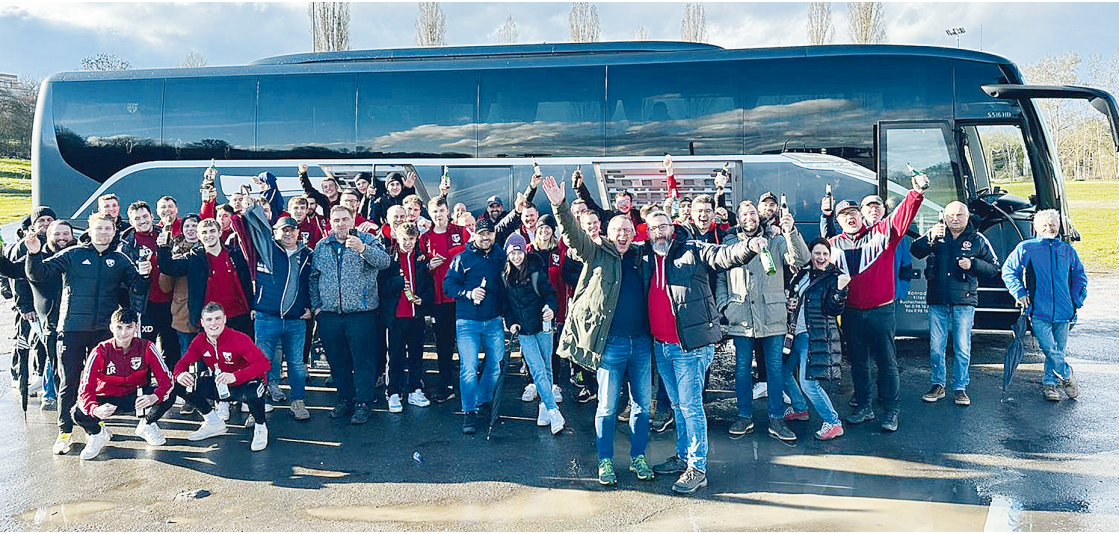
Busfahrt nach Buckenhofen