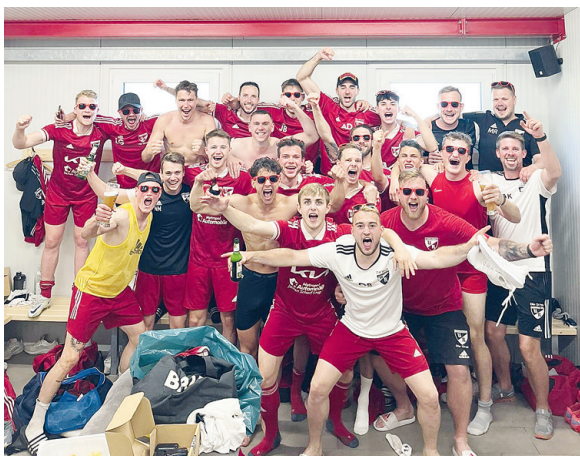
Und weiter geht's in der Kabine nach dem Mitterteich-Spiel