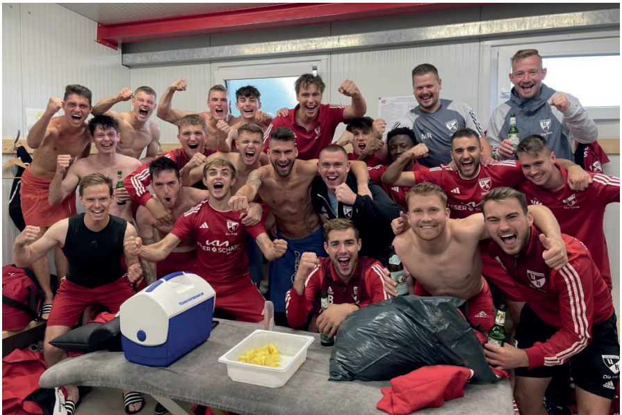
Nach dem Sieg gegen Groß'lohe