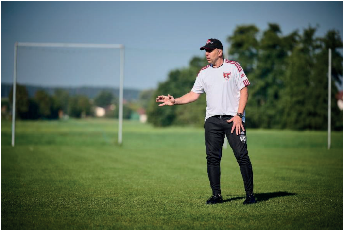
Auf der Suche nach der Wende!