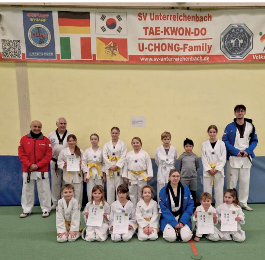
Kinder-Gruppe nach der Prüfung

Vor Weihnachten fand in unserer Sporthalle eine Gürtelprüfung statt. Alle Prüflinge haben die Prüfung zu ihrem nächsten Gürtel mit Erfolg abgelegt. Weiterhin gab es im Dezember auch eine Überprüfung von Erwachsenen zum 1. Kup. Auch hier konnte der Prüfer nur gratulieren.