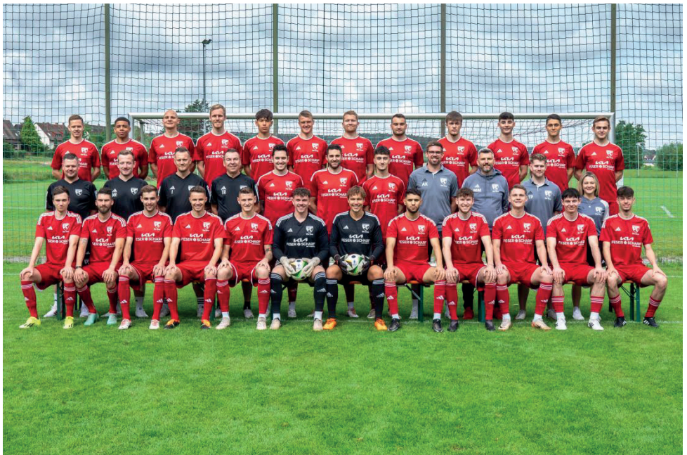
Mannschaftsfoto Landesligateam 2024/25