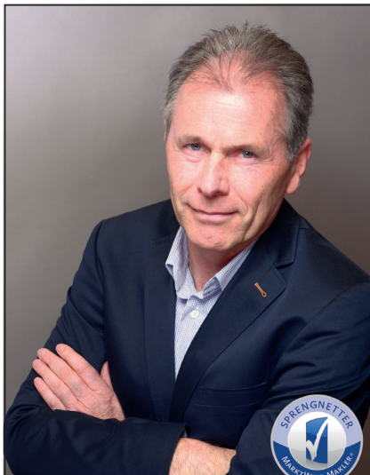
Jörg Freundorfer Immobilienmakler gepr. MarktWert-Makler®

Bei der D-Jugend gehen wir ja mit 2 Teams an den Start. Unsere D1 belegt nach einer Doppelrunde den 2. Platz in der Kreisliga. Sie haben damit noch alle Chancen in die Bezirksoberliga aufzusteigen. Die D2 belegt in der Kreisgruppe den 6. Tabellenrang. Hier ist noch ein bisschen Luft nach oben.