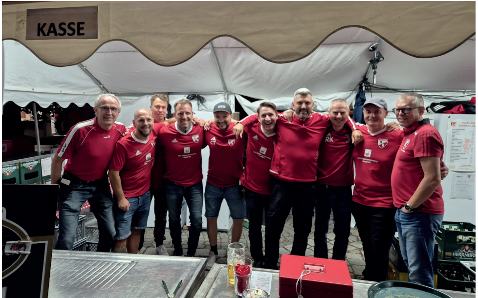
Die AH als fleißige Helferlein beim Bürgerfest